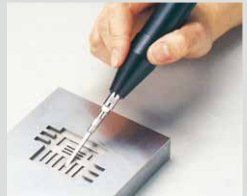
▲メタルボンド・ダイヤモンドチップで放電加工後の細部の磨きに。