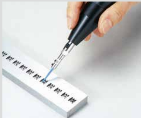
▲セラミック・スーパーストーンで極細部分の磨きに。